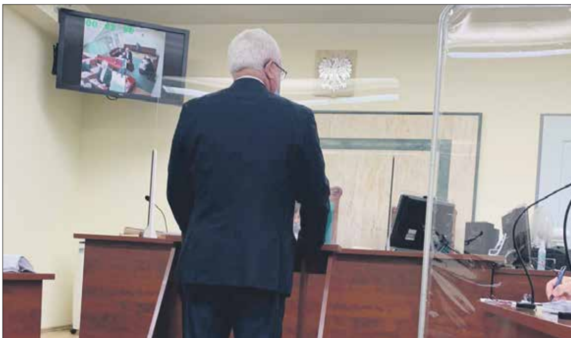
■ Proces byłego starosty trzebnickiego trwał kilka lat i zakończył się wyrokiem korzystnym dla przedsiębiorcy

O stracie może mówić również samorząd, bowiem sam fakt aktu oskarżenia wobec Starosty jako organu, bardzo negatywnie rzutuje na obraz Powiatu Trzebnickiego.