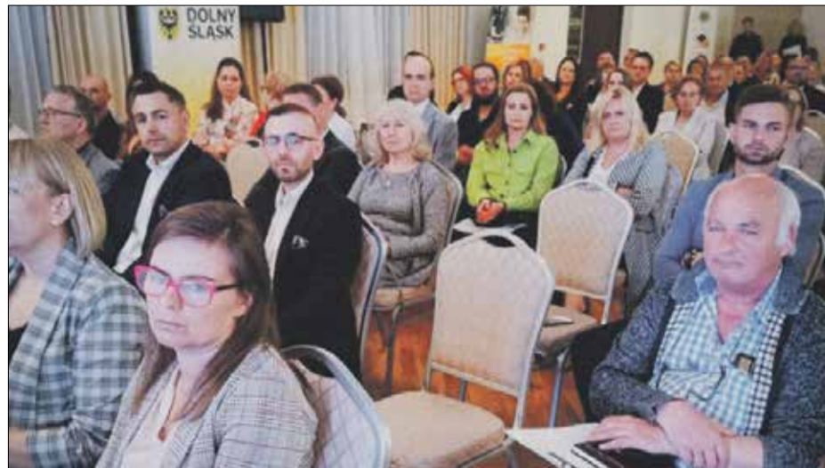
• Przedsiębiorcy z terenu powiatu trzebnickiego licznie przybyli na Powiatowe Forum