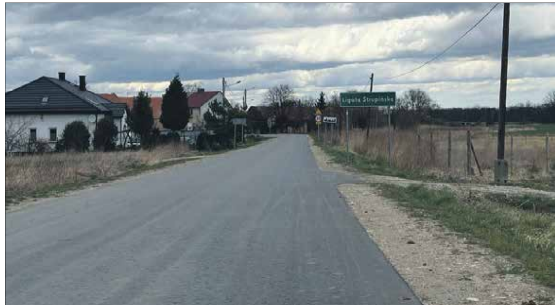
■ Wyremontowany odcinek drogi wykonany w 2021 roku

chaniczne ścięcie zawyżonych poboczy. Warto podkreślić, że Powiat Trzebnicki na tę inwestycję otrzymał blisko 100 tys. zł dofinansowania z Terenowego Funduszu Ochrony Gruntów Rolnych.