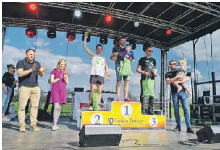
• Dekoracja najlepszych biegaczy

Skokowski Bieg Przelajowy to cykliczne spotkanie miłośników biegania. Na trudną, liczącą 6 kilometrów trasę zjechali nie tylko zawodnicy z Powiatu Trzebnickiego, ale również z powiatów ościennych.