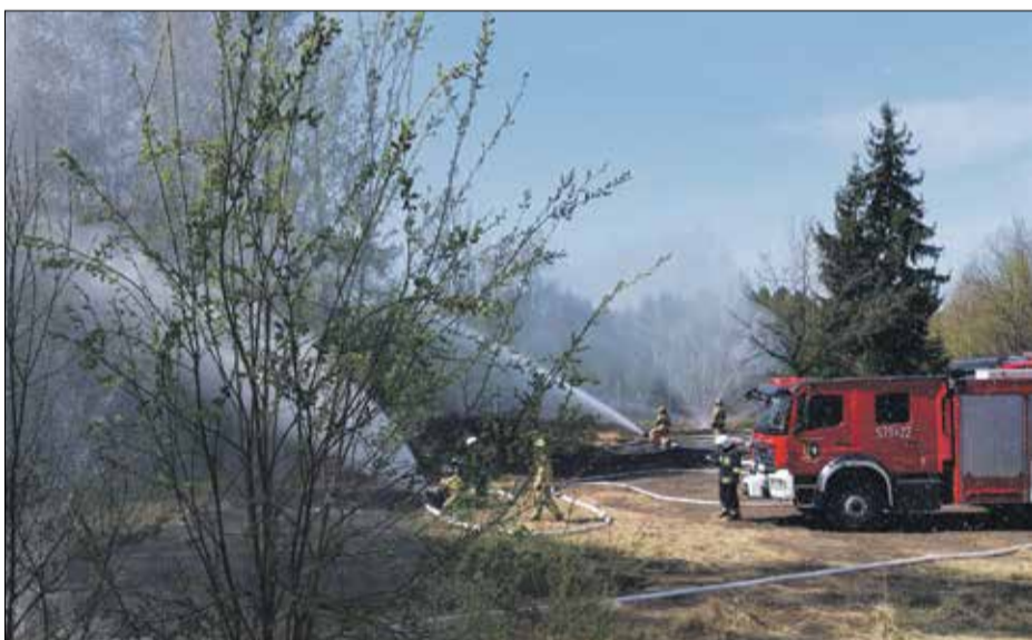
• Manewry jednostek ochrony przeciwpożarowej oraz Nadleśnictwa Żmigród

RP: W wymiarze służbowym coraz lepszych i bezpieczniejszych warunków pracy, które zdecydowanie się poprawiają, jednak rodzące się wyzwania i zadania wymagają nowych obiektów i innego sprzętu. Dlatego też, pomimo wszystko w różnych obszarach funkcjonowania jednostki wciąż pozostaje sporo aspektów, które powinny ulec modernizacji lub zmianie systemowej. Natomiast kolegom strażakom życzę aby pełniona służba była powodem do dumy i satysfakcji, by codziennie móc sprostać społecznemu zaufaniu, bo zaufanie to wciąż wskazuje, że nasza praca jest potrzebna i dobrze wykonywana w odczuciu mieszkańców naszego powiatu. Ponadto życzę również spełnienia i zadowolenia w życiu osobistym. Oczywiście Dzień Strażaka to tylko pretekst do życzeń, pragnę by były aktualne każdego dnia.