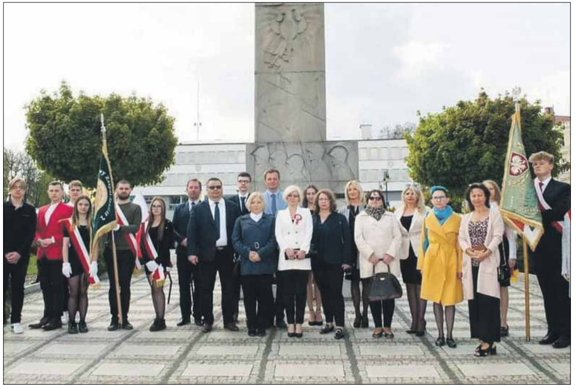
• Gmina Trzebnica

Dlatego szanujmy naszą współczesną konstytucję równie mocno jak tę uchwaloną 231 lat temu. Szanujmy naszą wolność i niepodległość.