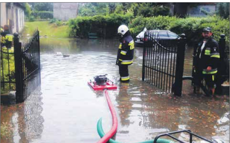
• Walka ze skutkami gwałtownych zjawisk atmosferycznych