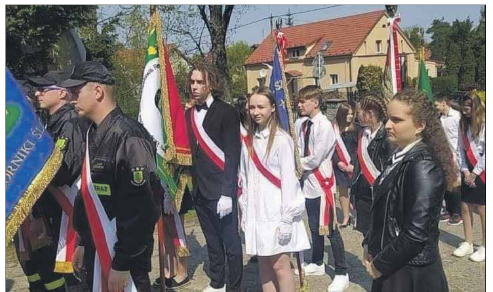
• Gmina Oborniki Śląskie