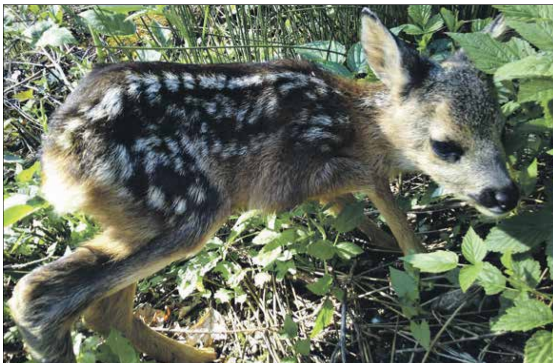
• Tegoroczne młode Sarny europejskiej. Leśnicy apelują o to, by nie dotykać młodych osobników zwierząt, co może spowodować odrzucenie ze strony matki lub dodatkowe narażenie na atak ze strony drapieżników na skutek pozostawionego zapachu w miejscu schronienia młodego zwierzęcia.

W tak bogatych warunkach przyrodniczych Nadleśnictwo Żmigród funkcje ochronne z powodzeniem łączy z gospodarczymi, co potwierdzić może fakt, że stanowisk chronionych i rzadkich gatunków roślin i zwierząt sukcesywnie przybywa. Jednym