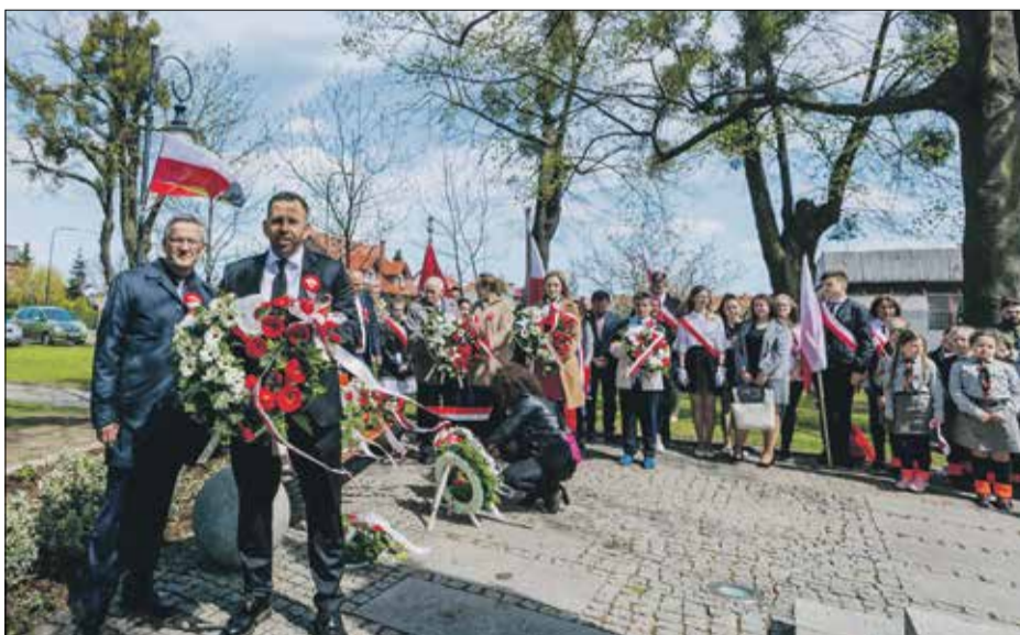
• Gmina Prusice