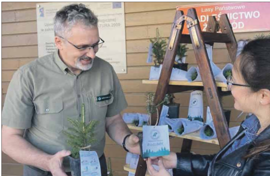
• 7 Jedną z akcji edukacyjnych, pn. „Nie siedź w domu, posadź drzewo”, jaką organizuje Nadleśnictwo Żmigród, by poszerzyć wiedzę społeczeństwa o prowadzonej w sposób zrównoważony gospodarce leśnej.

ZN: Sądze, że zwyczajnie zaufania do naszego doświadczenia i troski o nasze wspólne dobro, jakim są lasy, z opieki nad którymi czerpiemy ogromną satysfakcję.