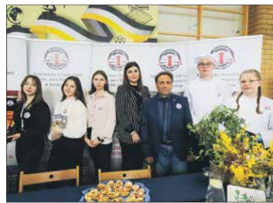
• Stoisko Powiatowego Zespołu Szkół w Żmigrodzie