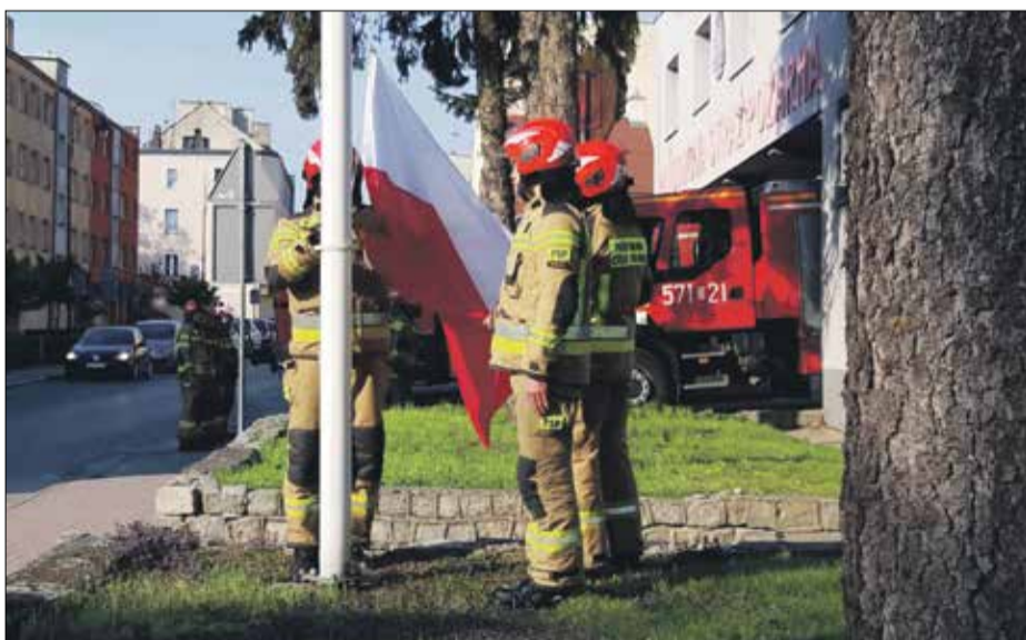
• 2 maja uroczyste podniesienia flagi państwowej z okazji Narodowego Święta Flagi