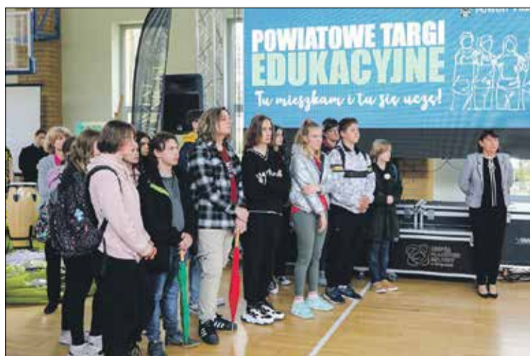
• Powiatowe Targi Edukacyjne w PZS w Obornikach Śląskich