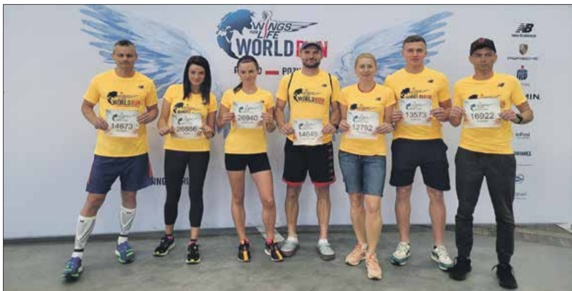
■ DTR Biega/Mario Team Trzebnica na międzynarodowym biegu Wings For Life World Run

8 maja 2022 roku dziesiątki tysięcy biegaczy na całym świecie wystartowało jednocześnie w bardzo szczytnym celu.