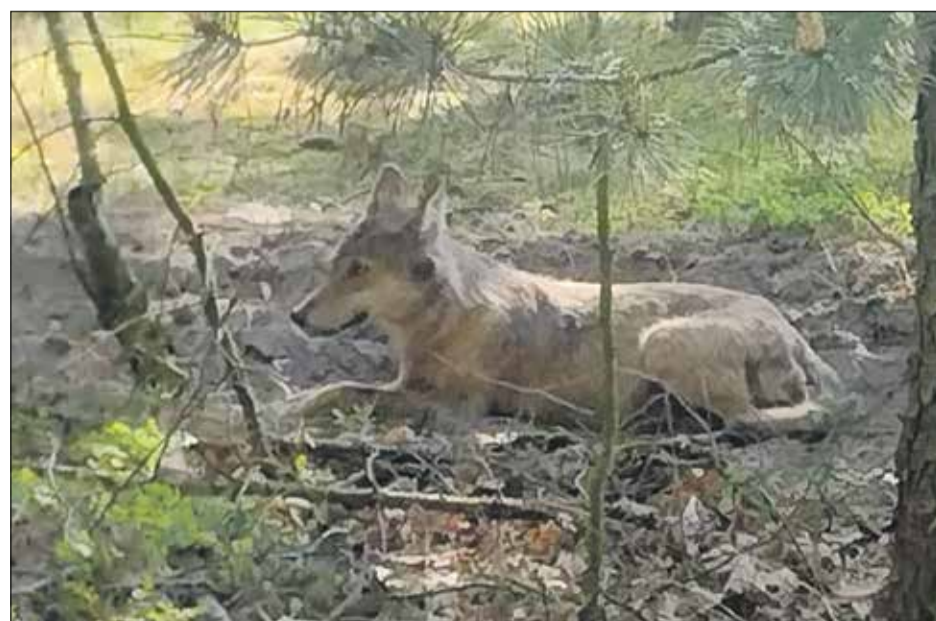
• Wilk na terenie Leśnictwa Borek.

działań jest wsiedlanie młodych osobników do specjalnie przygotowanych wolier adaptacyjnych, umieszczonych w koronach drzew, gdzie przez pewien czas młode sokoły są dokarmiane a po upływie około miesiąca uwalniane, by już na własną rękę mogły radzić sobie w naturze. Prowadzony od 2010 roku projekt, daje w chwili obecnej pierwsze spore efekty. Mianowicie możemy pochwalić się, tym, że na skutek naszych działań sokoły zadomowiły się w Żmigrodzkich lasach i zajmują kolejne przygotowane dla nich przez nas gniazda, w których od trzech lat obserwujemy,