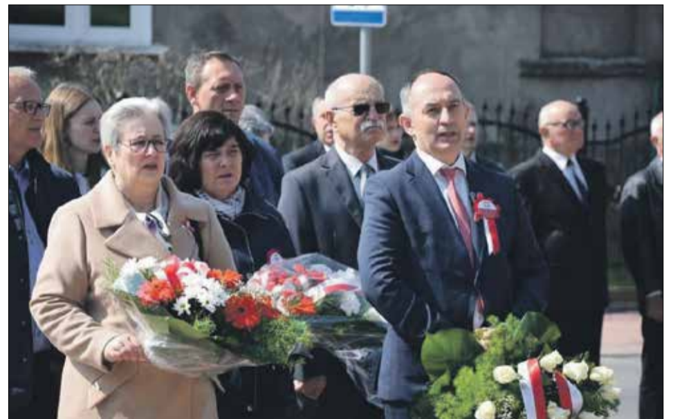
• Gmina Wisznia Mała