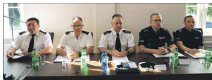
■ Przedstawiciele służb mundurowych