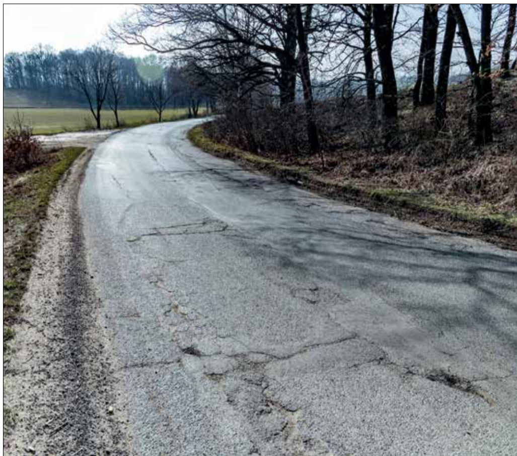
■ Wskazana droga pozwoli udrożnić ruch komunikacyjny na strategicznej drodze powiatowej, która łączy się z Powiatem Wrocławskim a następnie z drogą S8