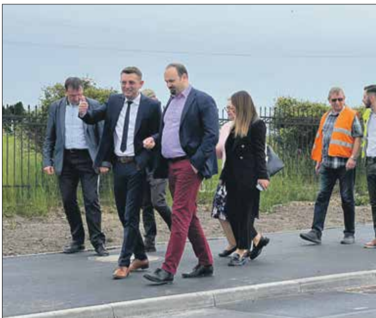
■ To kolejna drogowa inwestycja w Powiecie Trzebnickim zwiększająca bezpieczeństwo

Całkowity koszt inwestycji przekroczył 2,5 mln zł. Na to zadanie Powiat Trzebnicki pozyskał ponad 1,25 mln zł dofinansowania z Funduszu Dróg Samorządowych. Przebudowaliśmy ponad 1,5 km jezdni, a także wybudowaliśmy ciąg pieszo - rowerowy do wysokości cmentarza w Szewcach. Dzięki tej inwestycji bezpieczeństwo zarówno pieszych jak i pozostałych uczestników ruchu drogowego znacznie się poprawi. Warto również nadmienić, że ostatni już odcinek drogi powiatowej do Strzeszowa wraz ze skrzyżowaniem w Ozorowicach również zostanie przebudowany w tym roku. Rozpoczęcie prac planujemy na przełomie miesiąca lipca i sierpnia.