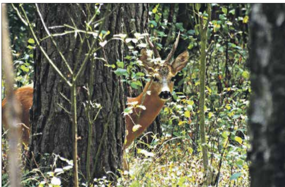
• Sarny europejskiej – kozioł.

Zdarza się również, że odwiedzający, przybywający do nas z odleglejszych miast i miejscowości pozostawiają pojazdy w nieodpowiednich miejscach, takich jak wjazdy na drogi leśne. Często niestety zastawiając szlabany leśne, które powinny być odczytywane jak znak drogowy- nie zastawiać, istotny dla ruchu