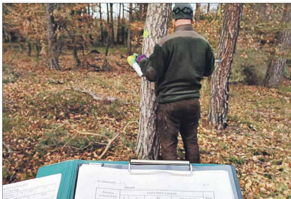
• Raptularz terenowy sporządzanych szacunków brakarskich- czyli dokładnych pomiarów drzew zaplanowanych do pozyskania w ramach użytkowania gospodarczego lasów.

ZN: Nadleśnictwo Żmigród prowadzi coroczną obserwację ilości zwierzyny występującej w naszych lasach, jak i poza nimi. Takie coroczne liczenie nazywa się inwentaryzacją zwierzyny. Na naszym terenie inwentaryzuje się następujące gatunki zwierząt: jelenie, danielle, sarny, dziki, lisy, borsuki, kuny, norki amerykańskie, tchórze zwyczajne, zające szaraki, dzikie króliki, jarząbki, bażanty czy kuropatwy. Tak zwaną zwierzynę grubą, tj. jelenie, danielle, sarny i dziki, liczy się – inwentaryzuje metodą bloków taksacyjnych, w trzeciej dekadzie lutego. W przypadku zwierzyny drobnej, czyli lisów, borsuków, kun, norek amerykańskich, tchórzy zwyczajnych, zajęcy szaraków, dzikich królików, jarząbków, bażantów czy kuropatw, ich liczebność określa się na podstawie całorocznej obserwacji prowadzonej przez