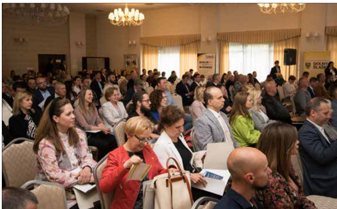
• Zainteresowanie wydarzeniem pokazało, że jest to potrzebna inicjatywa

„Przedsiębiorczość – Innowacyjność – Konkurencyjność. To sformułowania, które powinny stanowić podstawę myślenia o współczesnej rzeczywistości gospodarczej. To również zagadnienia, które będą stanowić podstawę naszej dyskusji o możliwościach rozwoju Powiatu Trzebnickiego, a przede