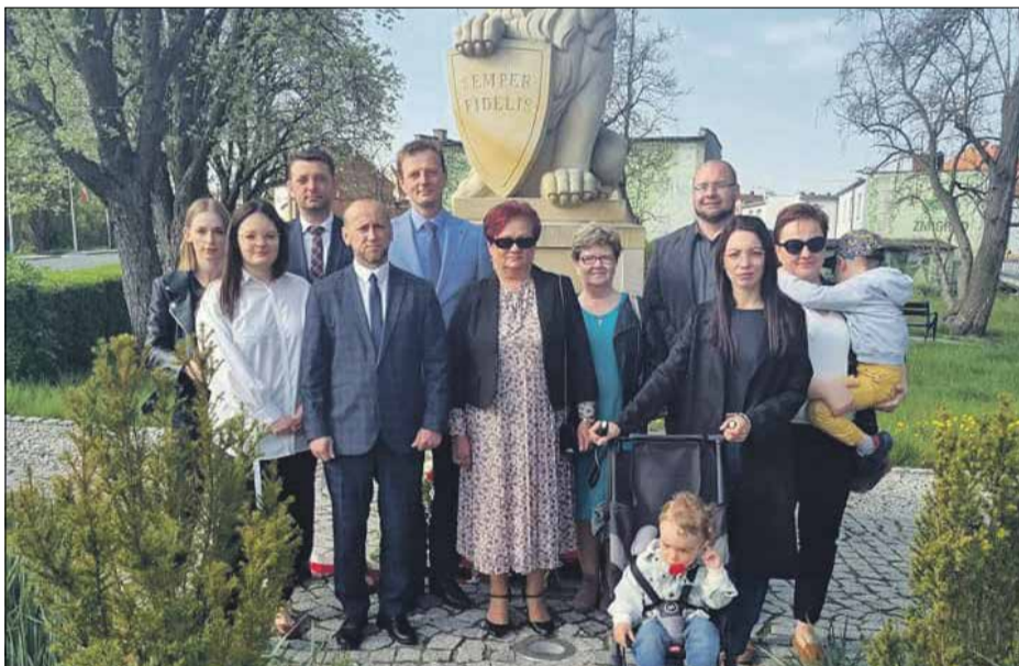
• Gmina Żmigród