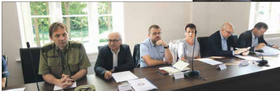
■ Przedstawiciel służby granicznej, służb medycznych, epidemiologicznych oraz drogowych