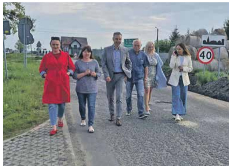
■ Droga w Przedkowicach niebawem będzie wyremontowana

Do połowy sierpnia 2022 roku zostanie wykonana przebudowa kilometrowej długości odcinek drogi między miejscowościami Dobrosławice i Przedkowice w gminie Żmigród.