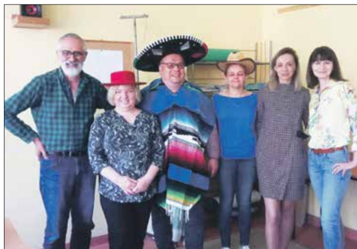
• Wspólna fotografia z podróżnikiem