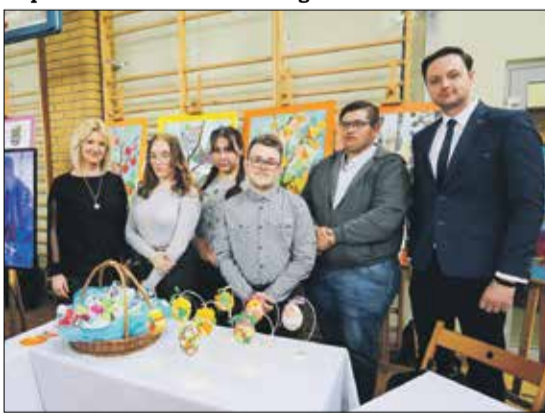
• Stoisko Powiatowego Zespołu Specjalnych Placówek Szkolno - Wychowawczych