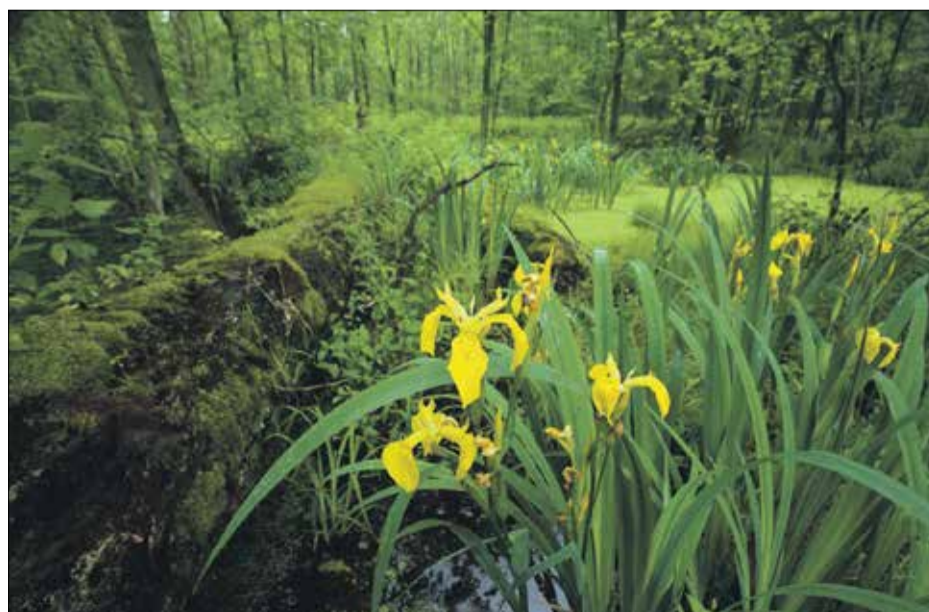
• Majowe kosaćce kwitnące w Rezerwacie Olszyny Niezgodzkie.