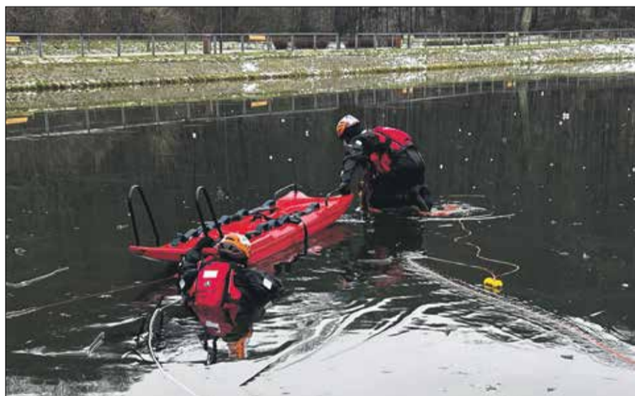
• Ćwiczenia trzebnickich strażaków w zakresie ratownictwa lodowego